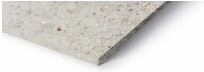
Swisspearl Multi Force

Swisspearl Multi Force Funktionstafeln werden für Leichtbauwände und -decken verwendet, die großen Belastungen standhalten und im Brandfall Schutz gewährleisten müssen. Sie erfüllen die Brandschutzklasse A1, je nach Wandaufbau kann mit diesem Paneel die Brandklasse EI 30 bis EI 120 erreicht werden.