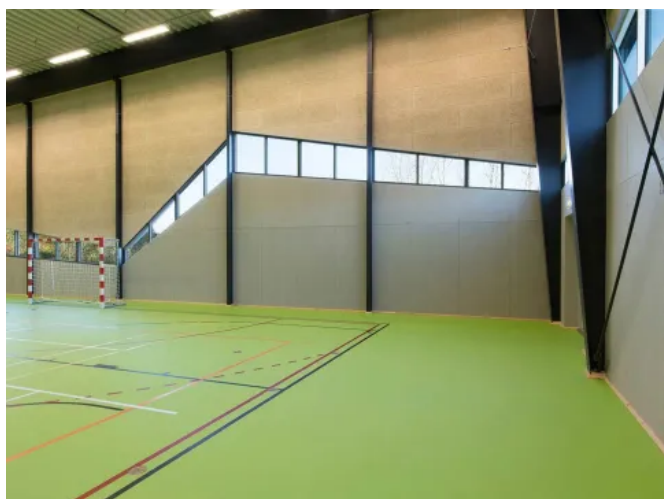
Schülerhort Himmerland, Dänemark

Produkte: Swisspearl Multi Force Naturgrau 000