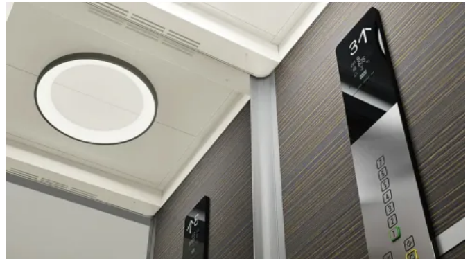
KONE ProSpace™ Plus Personenaufzüge verfügen über vollwandige Kabinen und automatische Kabinentüren.