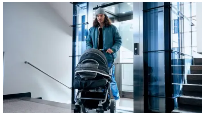
KONE ProSpace™ Plus ist ein maschinenraumloser Personenaufzug für den nachträglichen Einbau in engen Treppenhäusern von Wohngebäuden.

Als platz- und kosteneffiziente Lösung ist KONE ProSpace™ Plus für den nachträglichen Einbau in kurzer Zeit und mit begrenztem Platzangebot konzipiert. Er entspricht den Aufzugsnormen EN 81-20 und EN 81-50. Der KONE ProSpace™ Plus benötigt eine Schachtgrube oder Rampe von nur 10 cm. Die vormontierten Baugruppen lassen sich schnell und ohne weitere bauliche Maßnahmen montieren.