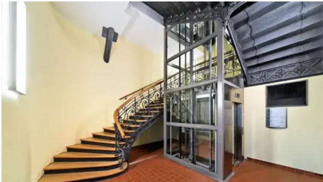
KONE ProSpace™ Plus ist eine selbsttragende Aufzugslösung, die nachträglich bis zu 16 Etagen verbindet.