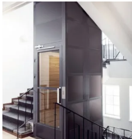
KONE ProSpace™ Plus, Schachtgerüst aus Stahl mit Blechverkleidung