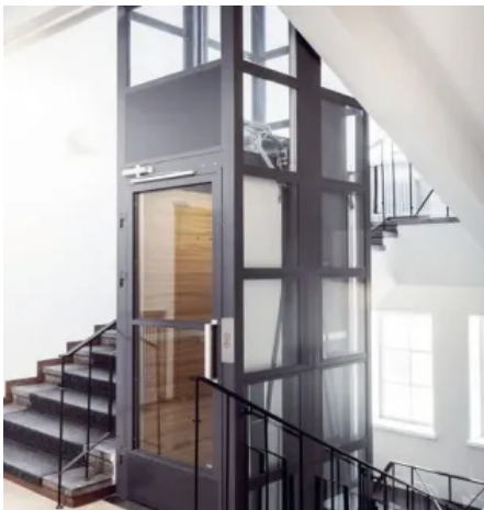
KONE ProSpace™ Plus, Schachtgerüst aus Stahl mit Vollverglasung