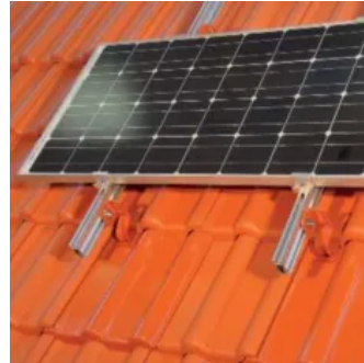
Aufdachmodulhalter HVS mit vertikaler Montage der Schienen