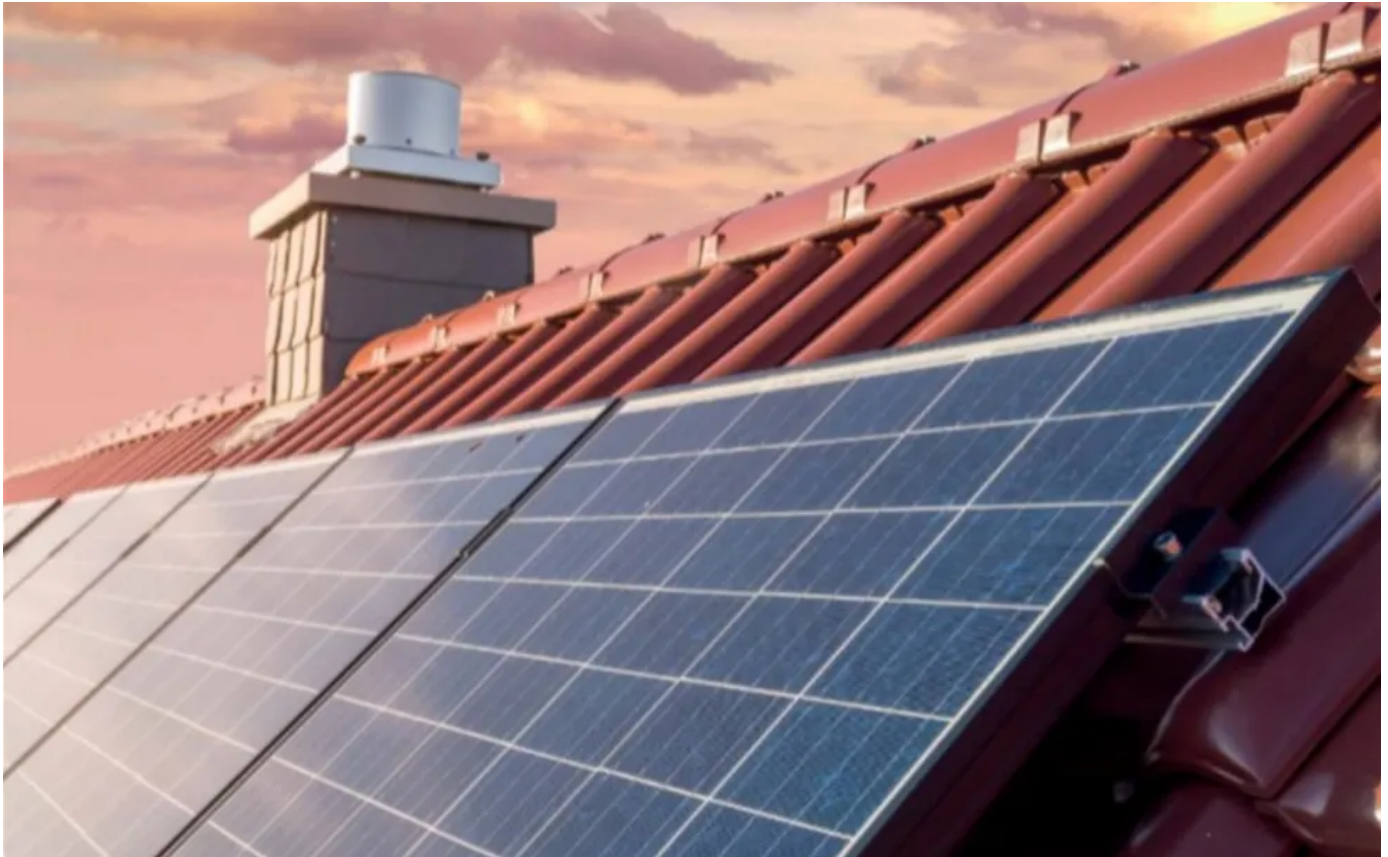
Die beiden Aufdachmodulhalter

Aus der Serie Befestigungslösungen für Solarthermie- und Photovoltaikanlagen von Otto Lehmann