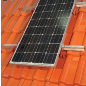
Aufdachmodulhalter HVS mit horizontaler Montage der Schienen

Vor dem Einbau ist die erforderliche Anzahl der Aufdachmodulhalter auf Grundlage der geplanten Konstruktion zu bestimmen. Dabei sind die Einwirkungen durch Wind gemäß DIN EN 1991-1-4 sowie durch Schnee gemäß DIN EN 1991-1-3 zu berücksichtigen.