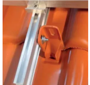
Verschraubung der Schiene am Aufdachmodulhalter HVS bei vertikaler Montage