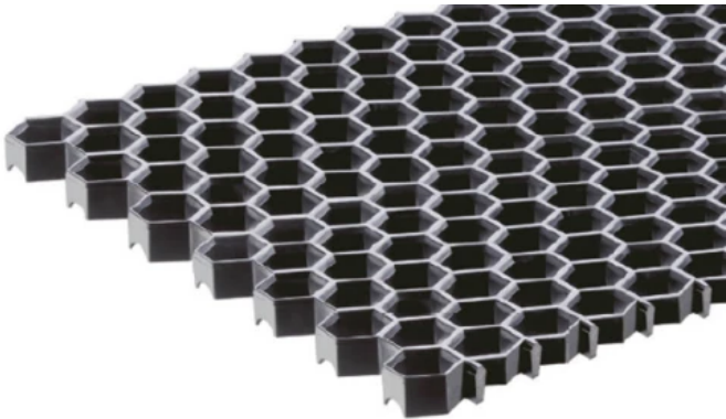
ARWEI Wabenmatte 6-Eck

Hochwertige, äußerst strapazierfähige Wabenmatte zur Grobschmutzaufnahme im Innen- und Außenbereich für normale bis extrem starke Frequentierung; rollstuhlgeeignet; für Privat, Bürogebäude, Schulen, Kindergärten, Krankenhäuser, Messehallen, Einkaufszentren, Flughäfen, Baumärkte, befahrbar; zur ganzflächigen Auflage