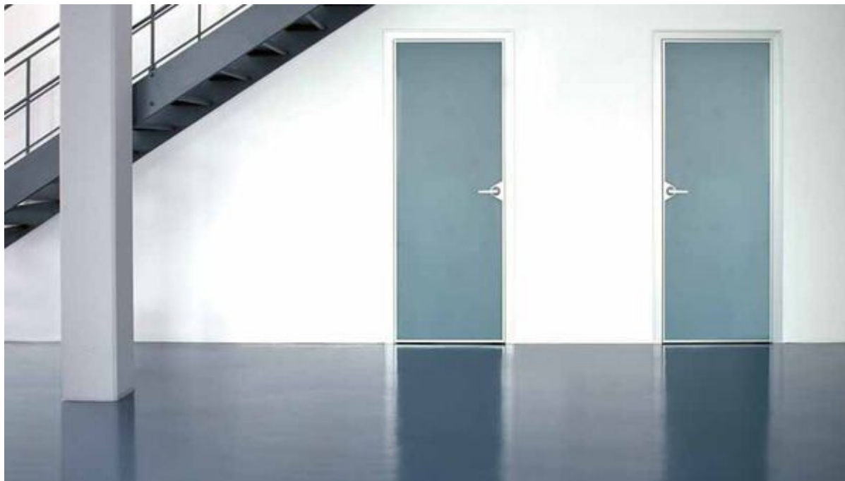
ARDEX Bodenspachtelmassen als Glätt- und Ausgleichsspachtel

Aus der Serie ARDEX Produkte für Rohbau, Estrich, Untergrundvorbereitung, Spachtelmassen von ARDEX