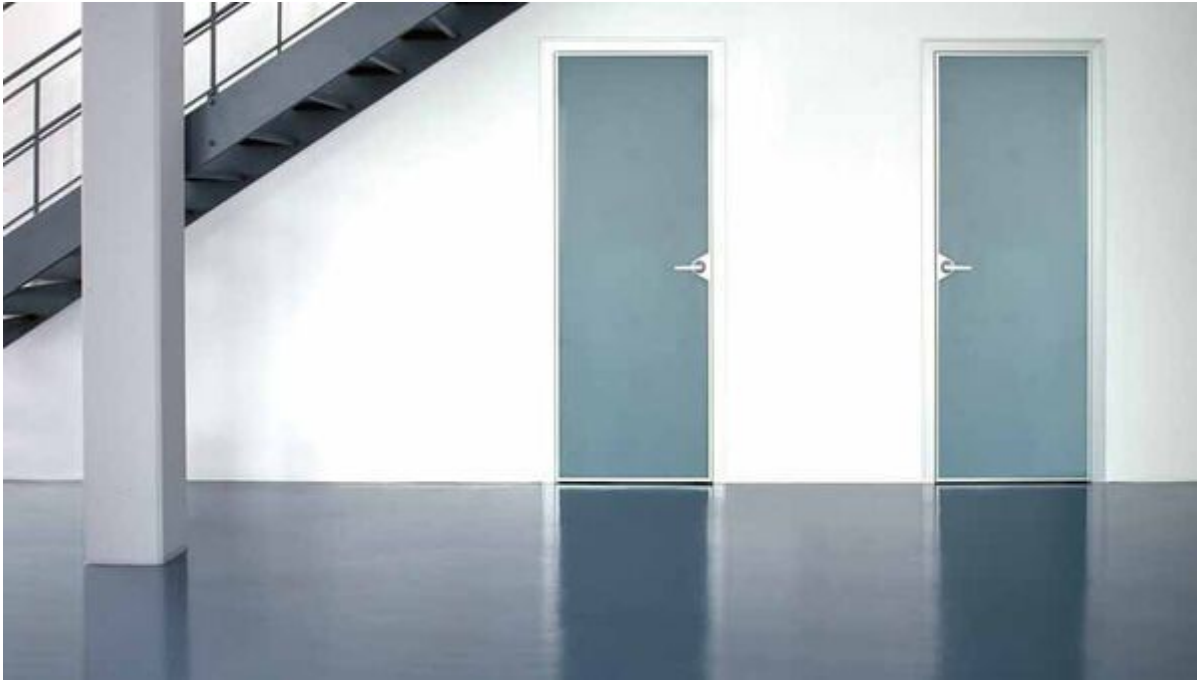
ARDEX Bodenspachtelmassen als Glätt- und Ausgleichsspachtel

Aus der Serie ARDEX Produkte für Rohbau, Estrich, Untergrundvorbereitung, Spachtelmassen von ARDEX