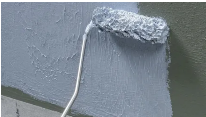
Normgerechte Abdichtungssysteme von ARDEX

Abdichtungen sind essenziell, um Schäden durch eindringendes Wasser in Bädern, Schwimmbecken oder auf Balkonen zu verhindern. Die Normenreihe DIN 18531 bis DIN 18535, insbesondere die DIN 18534 für Innenräume, gibt klare Vorgaben für die Abdichtung. ARDEX bietet passende Abdichtungsprodukte, die in Kombination mit Fliesenklebern und Fugmaterialien sehr hohe Sicherheit und Wirtschaftlichkeit bieten.