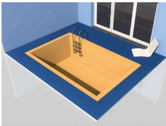
DIN 18535 – Abdichtung von Behältern und Becken