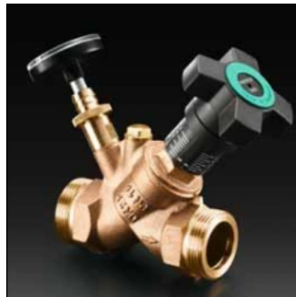
„Aquastrom C“ Strangreguliertventil aus Rotguss mit Thermometer für die Einstellung der Restvolumenströme.