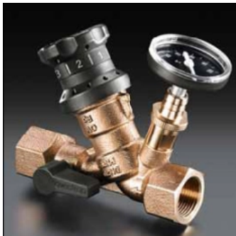
„Aquastrom VT“ Thermostatventil aus Rotguss mit voreinstellbarem Zirkulationsvolumenstrom im Betriebsbereich für Zirkulationsleitungen PN 16.

Eine Lösung zur Umsetzung der Trinkwasserverordnung bietet Oventrop mit dem Probenahmeventil aus Rotguss/Edelstahl „Aquastrom P“.