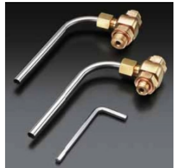
„Aquastrom P“ Probenahmeventil aus Rotguss/Edelstahl für eine hygienischmikrobiologische Untersuchung gemäß DVGW-Arbeitsblatt W 551 und Trinkwasserverordnung.