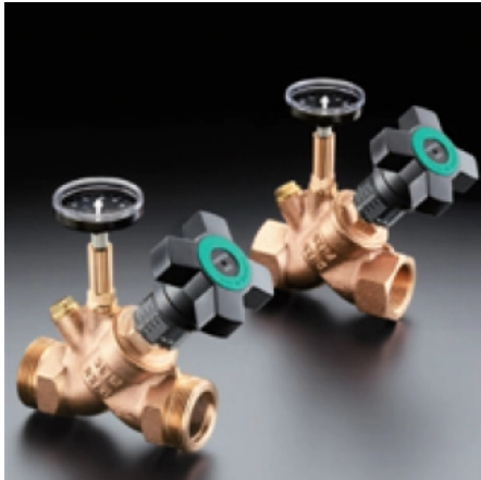
Thermostatische Regelventile für Zirkulationsleitungen

Aus der Serie Wasserarmaturen von Oventrop