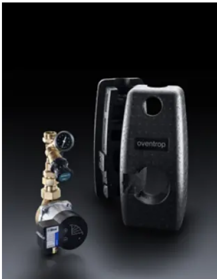
Zirkulationsstationen für Trinkwasser