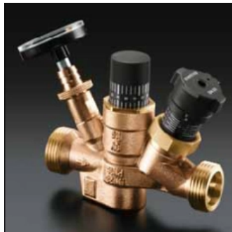
„Aquastrom T plus“ Thermostatventil aus Rotguss mit Voreinstellung für den hydraulischen Abgleich im Anfahrbetrieb in Zirkulationsleitungen PN 16.