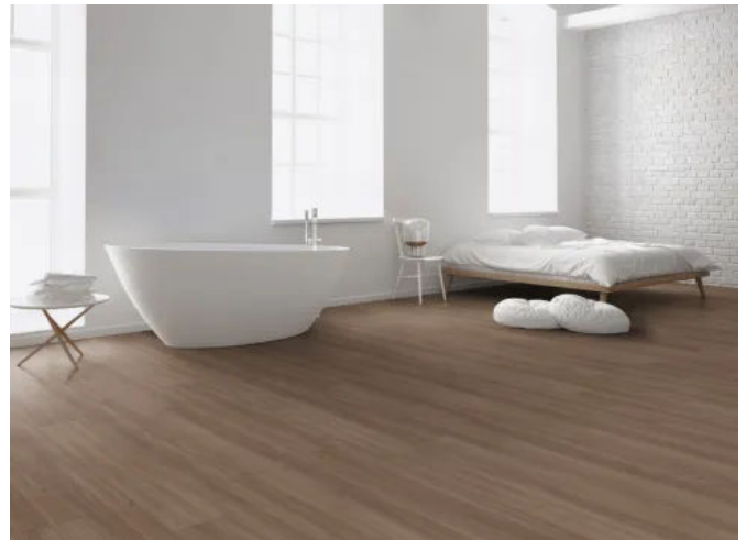
Kaindl AQUApro Dekor K2754 Oak-Aviva-BREEZE

Die AQUApro select Natural Touch- und Classic Touch-Kollektionen bringen natürliche Eleganz und Funktionalität in das Zuhause. Natural Touch überzeugt mit realistischen Eichendekoren und neuen Steindesigns in Farben von Silbergrau bis zu warmen Erdtönen. Die 48h wasserfeste Oberfläche, detailreiche Klassiker wie Milano oder Cordoba sowie moderne Designs wie „Strato Tile“ bieten langlebige Qualität und ein naturnahes Wohngefühl. Die breite Diele sorgt für einfache Verlegung und dynamische Optik. Classic Touch ergänzt das Sortiment mit zeitlosen Eichendekoren wie Ferrara und Zermatt, die durch edle Holzanmutung, lebendige Farbspiele und geringe Aufbauhöhe ideal für Renovierungen sind – ebenfalls mit zuverlässigem 48h Feuchteschutz.