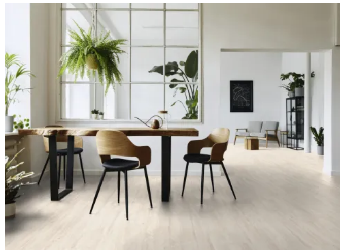
Kaindl AQUApro Dekor K2755 Travertin UMBRIA