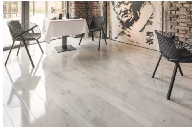
AQUApro Supreme

Die Böden haben eine spezielle AQUAtec HDF Trägerplatte und verfügen zusätzlich über eine verpresste Fase. Das macht sie noch widerstandsfähiger gegen Wasser und Schmutz. Das naturnahe Holz-Design bietet zwei authentische Oberflächenstrukturen.