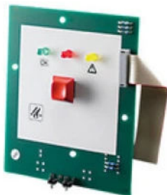
Zusatzmodul RWA-Bedienstelle TRZ/RBH-Basic