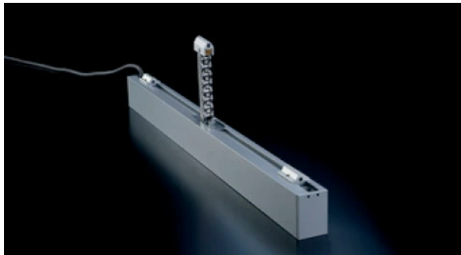
24 V Kettenantrieb LM

Aus der Serie Fensterautomation, Natürliche Be- und Entlüftung, RWA-Anlagen von Kingspan STG