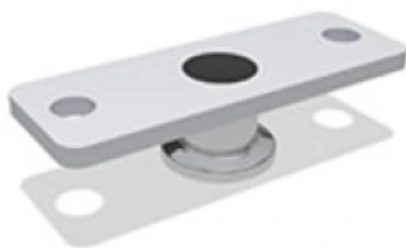
Zubehör RM mini

Passendes Zubehör wie Mitnehmerzungen oder Folgesteuern abgestimmt auf das individuelle System.