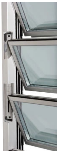
LDH 800–070 (RWA geprüft EN 12101–2)