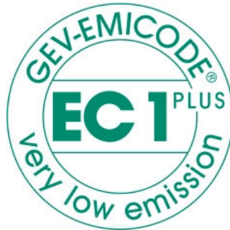
Zertifikat EC1 Plus