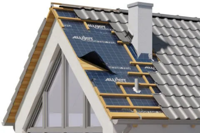
ALUJET Rooftop TPU