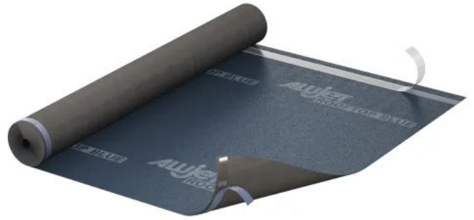
ALUJET Rooftop BLUE