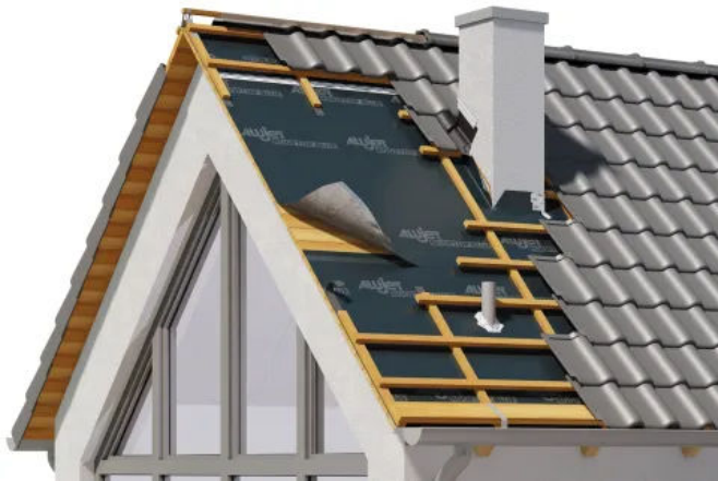
ALUJET Rooftop BLUE