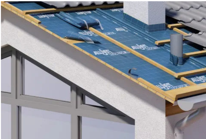
ALUJET Rooftop WU