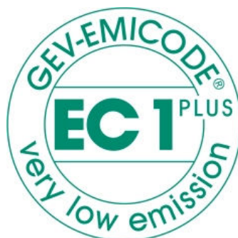
Zertifikat EC1 Plus