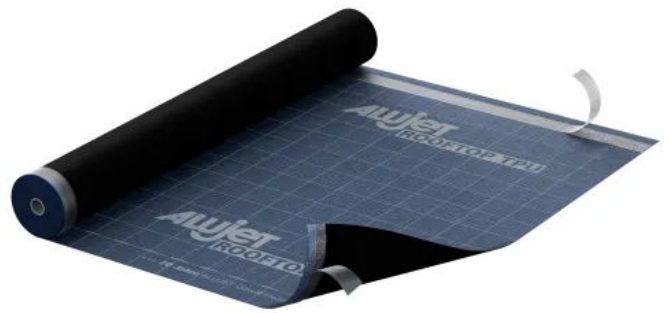
ALUJET Rooftop TPU