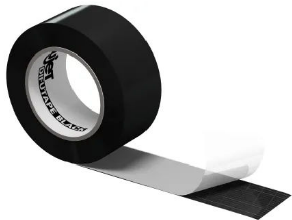
ALUJET Difutape BLACK