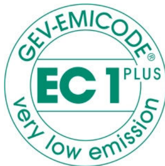
Zertifikat EC1 Plus