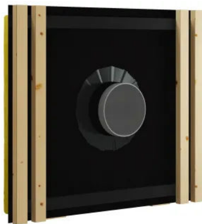
ALUJET Difutape BLACK