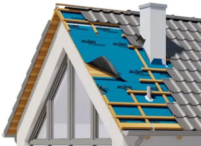
ALUJET Master Unterdeck- und Unterspannbahn