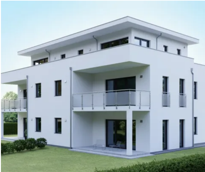
VEKA Fenstersystem AluConnect

Aus der Serie VEKA Fensterprofilsysteme von VEKA