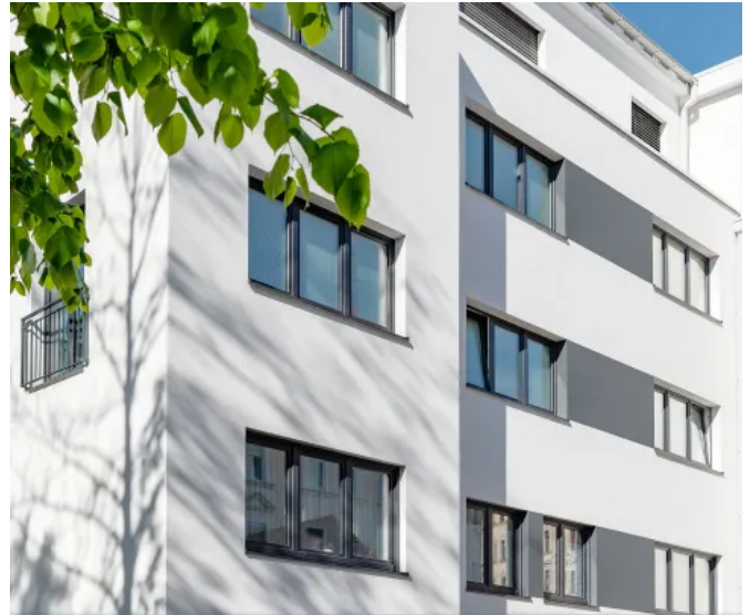
VEKA Fenstersystem AluConnect