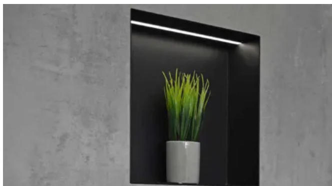
alferbox LED-Einbaunische, mit schmaler Sichtkante 2 mm