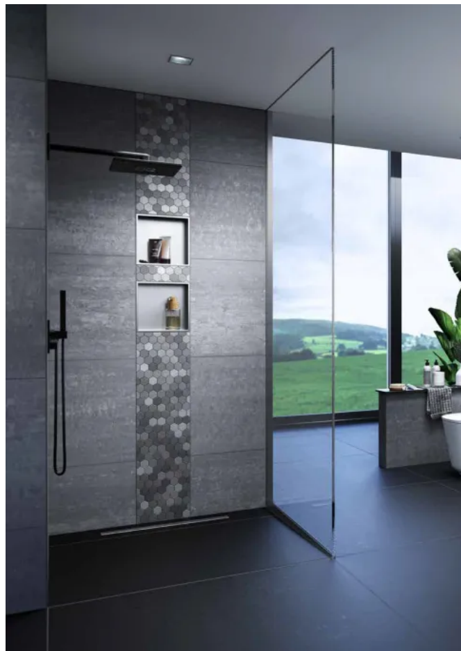
alferbox Einbaunische 300 x 300 mm, Edelstahl Seidenmatt