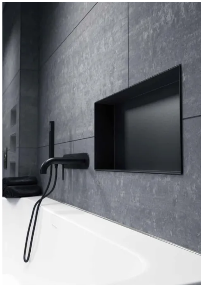
alferbox Einbaunische 300 x 600 mm, Edelstahl Schwarz pulverbeschichtet matt

Die Einbaunischen aus rostfreiem Edelstahl eignen sich für mittlere mechanische Belastungen im Innen- und Außenbereich und verfügen über eine hohe Beständigkeit gegenüber Chemikalien.