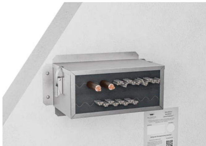
Akustikbox E Wandeinbau