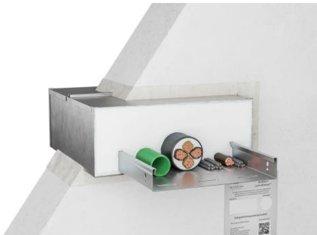
Akustikbox S Wandeinbau