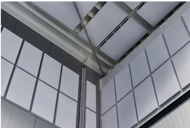
FLEX Magneto Industry Magnet-Schallabsorber Zum Produkt