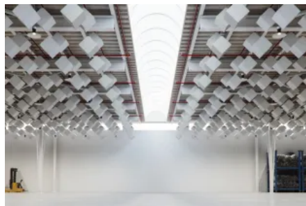
CUBIX Industry Hocheffektive Schallschutz-Würfel Zum Produkt