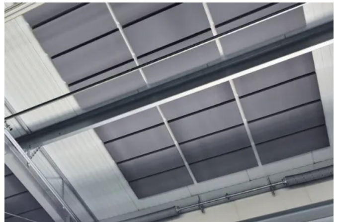
FLEX Industry Selbstklebende Akustikplatten Zum Produkt