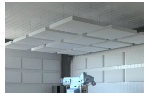
HORIZON Industry Akustiksegel für die Industrie Zum Produkt