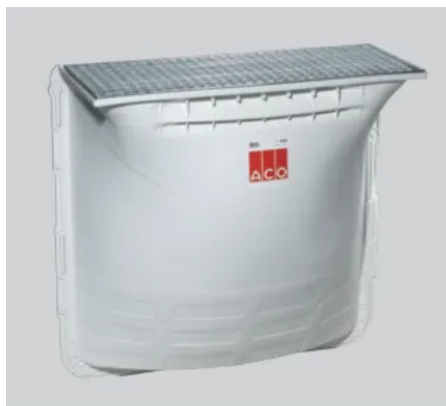
ACO Therm® Lichtschacht 40er Tiefe

Der Lichtschacht von ACO bringt Licht und Frischluft in Kellerräume. Durch die hochweiße Innenfläche wird ein besonders hoher Lichteinfall durch eine Lichtreflexion ermöglicht.