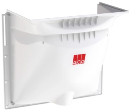
ACO Therm® Lichtschacht, 60er Tiefe

Der Kellerlichtschacht von ACO überzeugt mit optimierter Bauteilgeometrie und einem dreiseitigem Gefälle Richtung Entwässerungsöffnung. Die Öffnung befindet sich zudem noch 152 mm von der Wand entfernt und vereinfacht so die Dämmung.