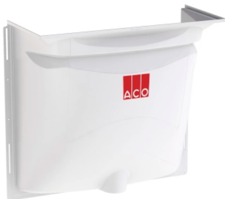
ACO Therm® Lichtschacht, 70er Tiefe

Der ACO Lichtschacht in 70er Tiefe ist für den Einsatz von breiten Kellerfenstern geeignet. Dadurch wird ein hoher Lichteinfall im Untergeschoss ermöglicht.