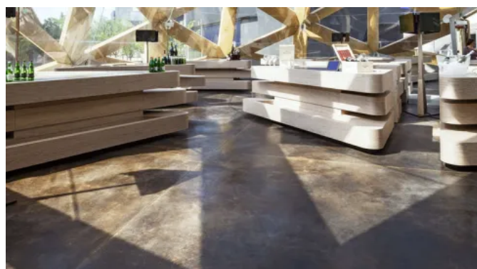
Acid-Stain-Dekorböden erhalten einzigartige Oberfläche, die nicht mit anderen gefärbten Materialien reproduziert werden kann.

Das Ergebnis ist einzigartig für jede Oberfläche und die Betonböden verlieren dadurch ihr Erscheinungsbild und gewinnen statt dessen natürliche Schönheit.