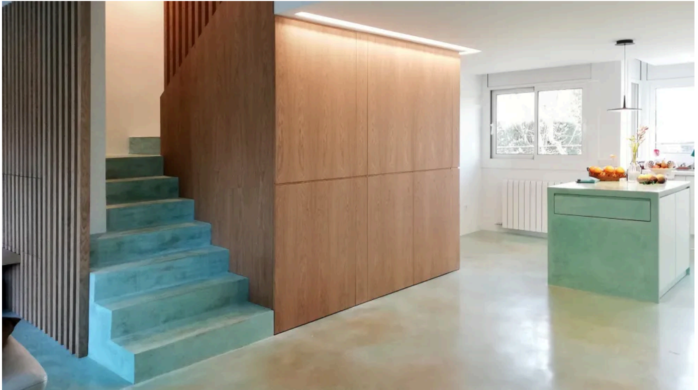
Auch Treppen lassen sich mit Acid-Stain-Dekorboden realisieren.

Aus der Serie Fugenlose Wand- und Bodenbeschichtungen von IDEAL WORK SRL