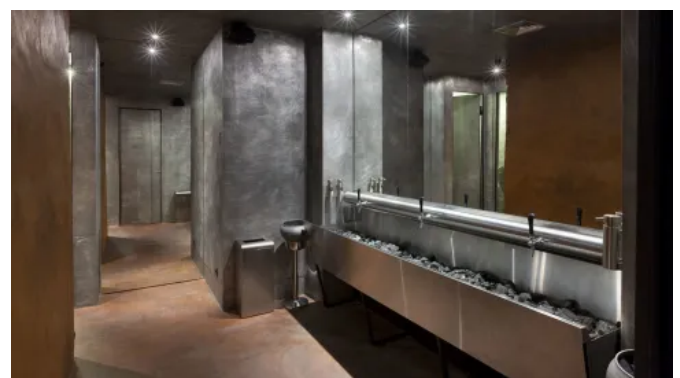
Auch vertikale Oberflächen von Wänden und Einrichtungen lassen sich mit Acid-Stain behandeln.

Auch vertikale Oberflächen von Wänden und Einrichtungen sowie Treppen lassen sich mit Acid Stain Dekorboden behandeln.