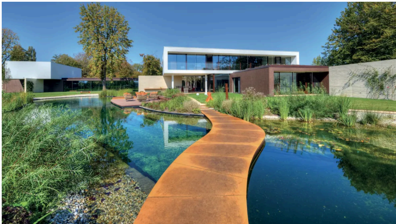
Acid Stain ist für Anwendungen im Außenbereich geeignet.

Aus der Serie Fugenlose Wand- und Bodenbeschichtungen von IDEAL WORK SRL