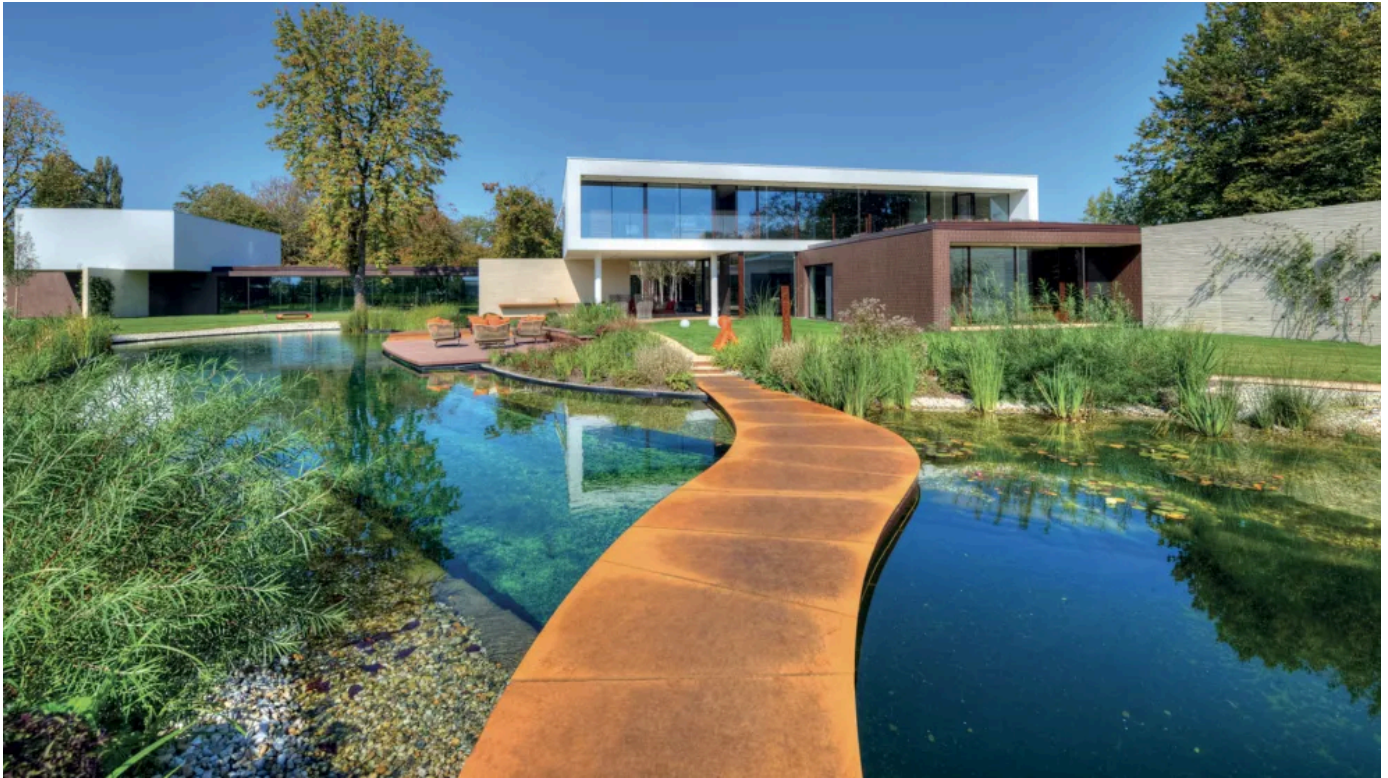
Acid Stain ist für Anwendungen im Aussenbereich geeignet.

Aus der Serie Fugenlose Wand- und Bodenbeschichtungen von IDEAL WORK SRL