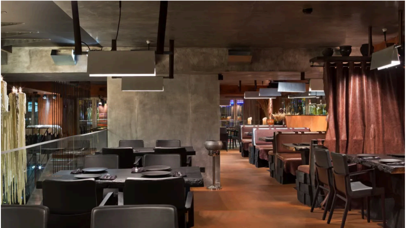
Nuancierende Farbeffekte von Acid Stain Dekorböden ähneln alternden, antiken Betonböden.

Aus der Serie Fugenlose Wand- und Bodenbeschichtungen von IDEAL WORK SRL