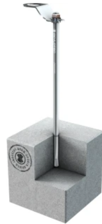
Einzelanschlagpunkt SEKURANT® MONO TYP 39

SEKURANT® MONO TYP 39 steht hier stellvertretend für alle Varianten der Serie SEKURANT MONO.