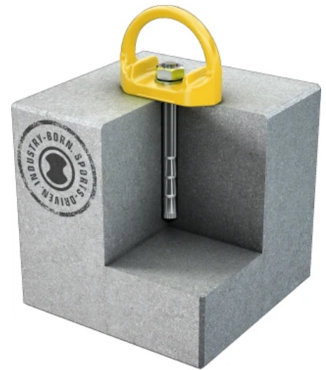
Einzelanschlagpunkt AP-TYP-42 der D-BOLT Serie

D-BOLT AP-TYP-42 steht hier stellvertretend für alle Varianten der Serie D-BOLT.