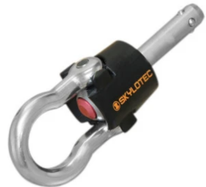
Einzelanschlagpunkt MOBILFIX AP-018

MOBILFIX AP-018 steht hier stellvertretend für alle Varianten der Serie MOBILFIX.