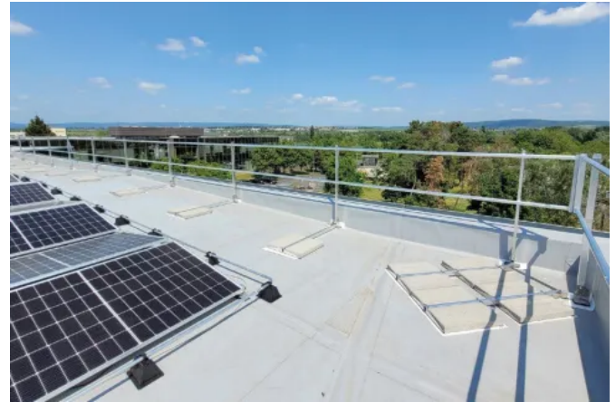
Die auflastgehaltene LUX-top® G-T Seitenschutzsysteme werden durchdringungsfrei mit Ballastbescherung montiert.