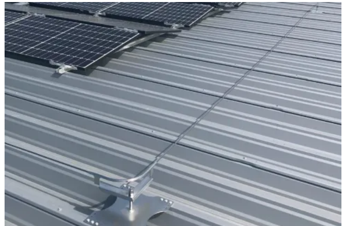
Das Seilsicherungssystem ist mit Anschlagpunkten für verschiedene Untergründe - auch in überfahrbarer Ausführung - lieferbar.