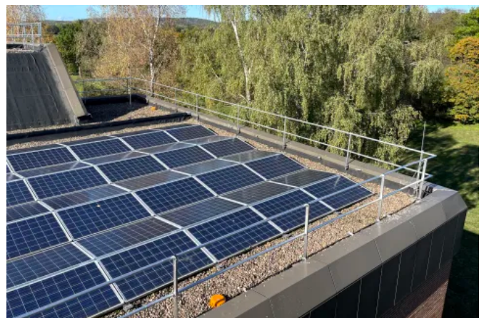
Ein Kollektivschutz bietet eine freie Beweglichkeit ohne Begrenzung der Personenzahl, da keine Befestigung der PSAgA notwendig ist.

Mit neigbare, höhenverstellbare und gebogene Ausführungen und verschiedenen Montagevarianten bietet das LUX-top® G-T Seitenschutzsystem eine flexible Anpassung an Dachabdichtungen, Gründächer, Dachbekiesungen sowie Belichtungselemente und PV-Anlagen.