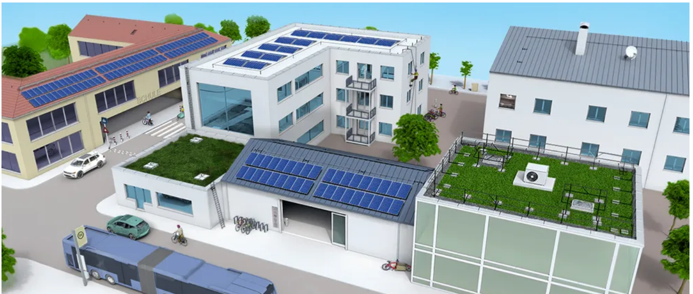
Die verschiedenen LUX-top® Absturzsicherungssysteme bieten für jedes Dach mit PV-Anlage eine passende Lösung.