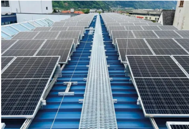
LUX-top® FSE 2003 Seilsystem bietet Arbeitssicherheit für bis zu 6 Personen gleichzeitig, z.B. bei Schneerräumung der PV-Anlage.

Aus der Serie Absturzsicherungen LUX-top® von ST QUADRAT Fall Protection S.A.