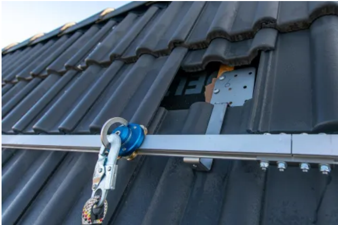
Der LUX-top® Halter Steildach (SD) dient als Schienenhalter zur Montage auf Dächern mit Dachziegel- oder Schieferdeckung.

Aus der Serie Absturzsicherungen LUX-top® von ST QUADRAT Fall Protection S.A.