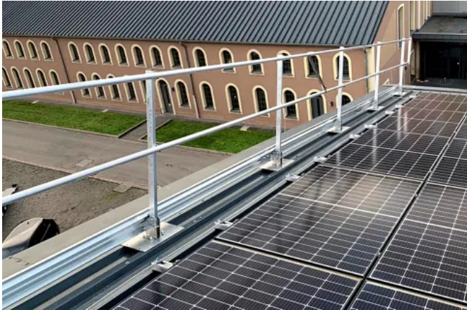
LUX-top® G-T DIREKT Seitenschutzsysteme sind als neigbare, höhenverstellbare und gebogene Geländer erhältlich.

Aus der Serie Absturzsicherungen LUX-top® von ST QUADRAT Fall Protection S.A.