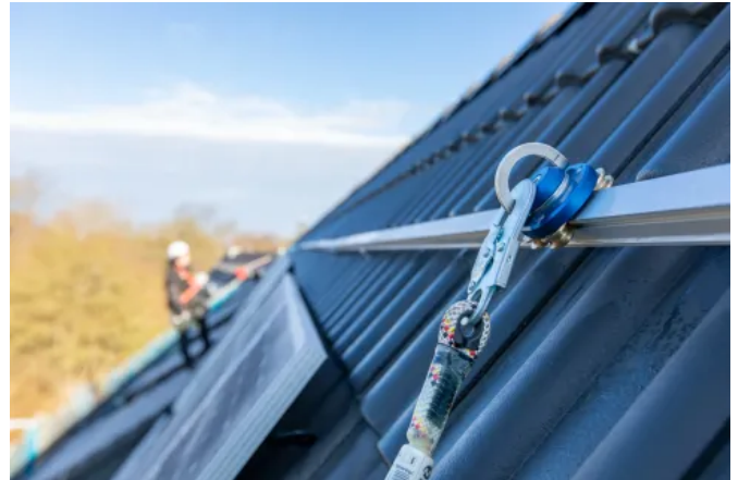
Das Absturzsicherungssystem LUX-top® FSA 2010-H lässt sich geometrisch an die PV-Anlage und farblich an das Dach anpassen.

Diese Systeme sind ebenfalls nach relevanten Normen, der DIN EN 795 und DIN CEN/TS 16415, geprüft und vom DIBt bauaufsichtlich zugelassen.