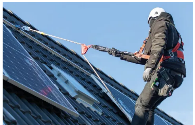
Das LUX-top® FSA 2010-H Schienensystem ist mit LUX-top® Haltern Steildach (SD) vom DIBt zugelassen.

Das Schienensystem LUX-top® FSA 2010-H ist für die Befestigung der persönlichen Schutzausrüstung gegen Absturz (PSAgA) nach DIN EN 795 und DIN CEN/TS 16415 geprüft und vom DIBt bauaufsichtlich zugelassen.