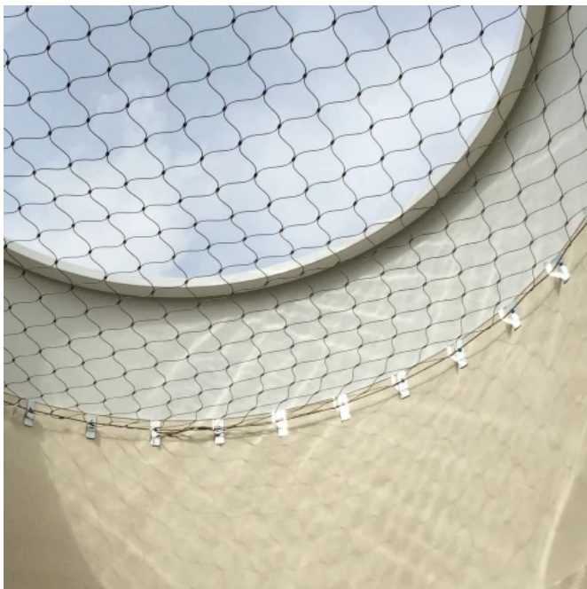
SECU® NET Edelstahl rechteckig

Um Einbrüche über Lichtkuppeln oder Lichtbänder zu verhindern, kann das SECU® NET mit einbruchshemmenden Sicherungen an den Ecken erweitert bzw. nachgerüstet werden.