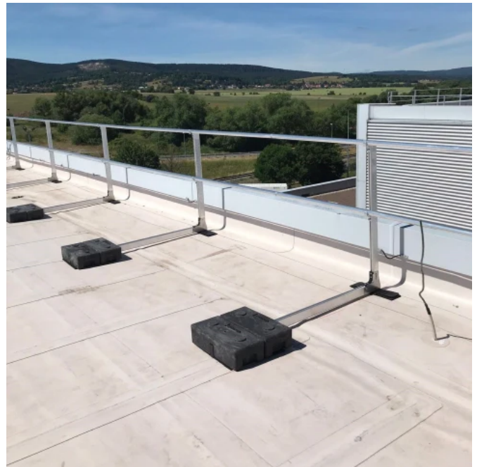
Absturzsicherungssystem SECU® RAIL 2.0

Zertifiziert nach EN ISO 14122 - 3: 2016