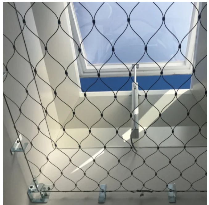
SECU® NET Edelstahl rund