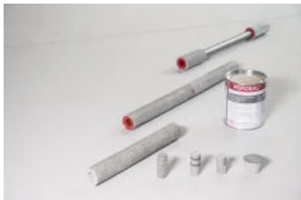
Mauerstärke aus Faserbeton