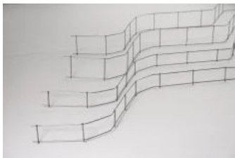
U-Korb® Abstandhalter aus Stahl