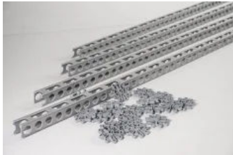
Abstandhalter aus Kunststoff

Aus der Serie MAX FRANK Produkte und Service von Max Frank