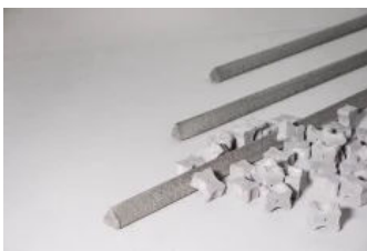
Einzelabstandhalter aus Faserbeton