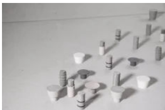
Verschlusskonen und Verschlussstößel