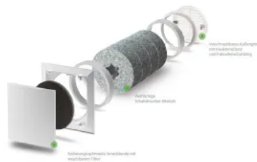
Außenwand-Luftdurchlass, ALD-S: für hohe Schallschutzanforderungen