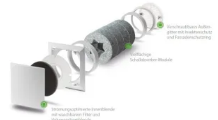
Außenwand-Luftdurchlass ALD-SV: für hohe Volumenströme bei erhöhtem Schallschutz

Mehr Informationen zu Außenwanddurchlässen