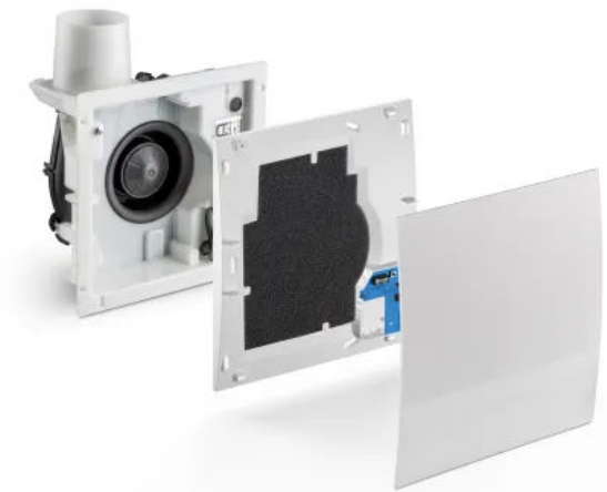
Abluftsystem Silvento ec KL: Klemmlüfter für die universelle Schnellmontage