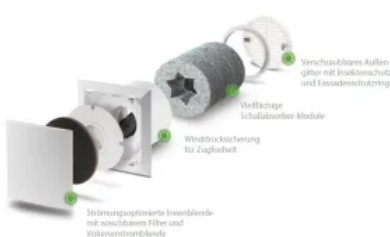
Außenwand-Luftdurchlass ALD: für alle Anwendungen, insbesondere für den Einsatz in Wohn- und Schlafräumen

Die Außenwand-Luftdurchlässe ALD, ALD-SV und ALD-S dienen als passive Nachströmung für Wohn- und Schlafräume. Sie werden vor allem in Kombination mit LUNOS-Abluftgeräten der Baureihe Silvento genutzt. Durch die Ablüfter in den Funktionsräumen, wie Bad und Küche, wird ein stetiger Unterdruck gebildet, der über die Außenwand-Luftdurchlässe Frischluft in das Haus transportiert. Bei normgerechter Planung kann so eine nutzerunabhängige Lüftung nach DIN 1946-6 sichergestellt werden.