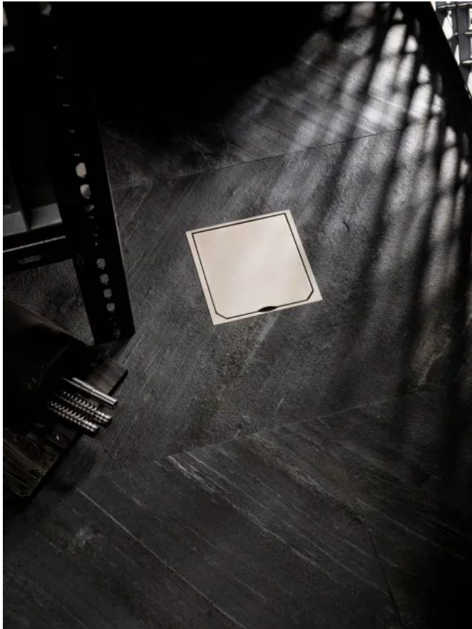
ABL BOWAmaxi Bodensteckdose mit Klappeckel

Aus der Serie eMobility und Connectivity von ABL