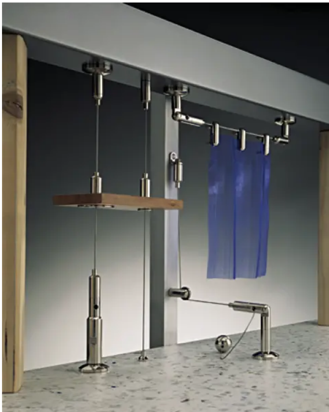
POSILOCK bietet ein ganzes System von Möglichkeiten für Innenarchitektur und Ladenbau