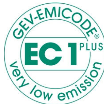
Zertifikat EC1 Plus