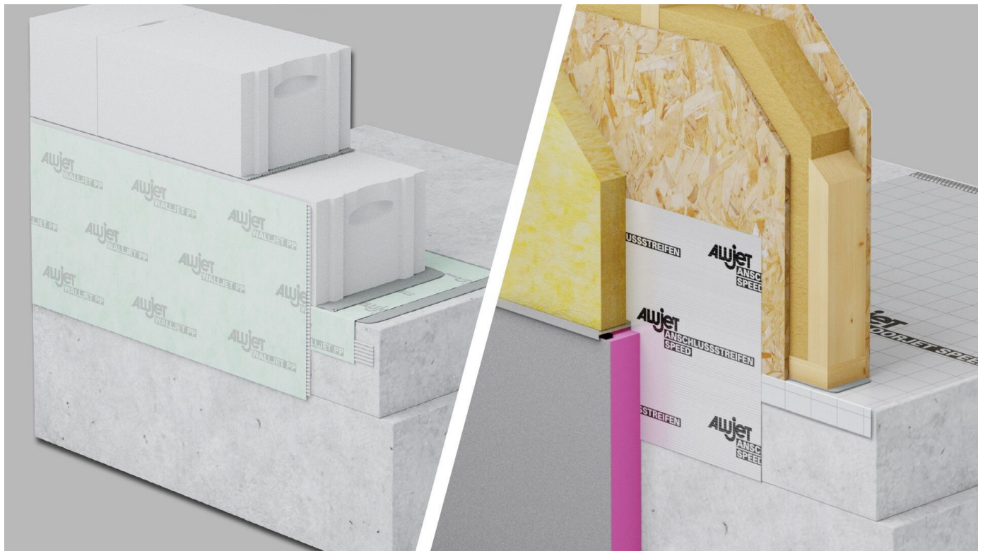
Abdichtungssysteme für die Sockelabdichtung.

Aus der Serie ALUJET Abdichtungsbahnen: Flächenabdichtung, Mauersperrbahn, Sockelabdichtung von ALUJET