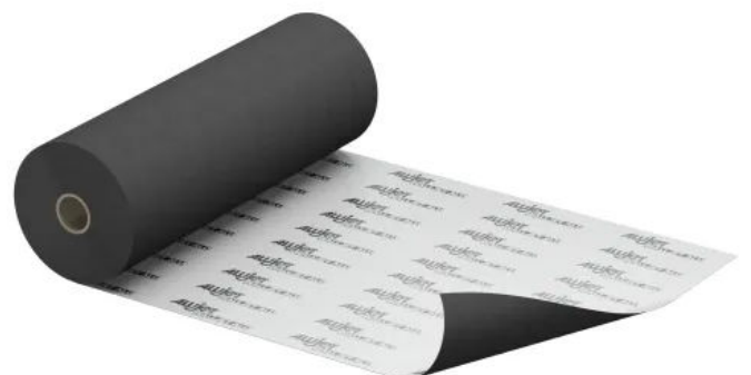
ALUJET Walljet ALU

Die ALUJET Walljet ALU besteht aus einem bitumenfreien, bitumenbeständigen Aluminium-Verbundschichtaufbau. Eine robuste PET-Versiegelung schützt die Aluminiumfolie vor Alkali und mechanischer Beschädigung.