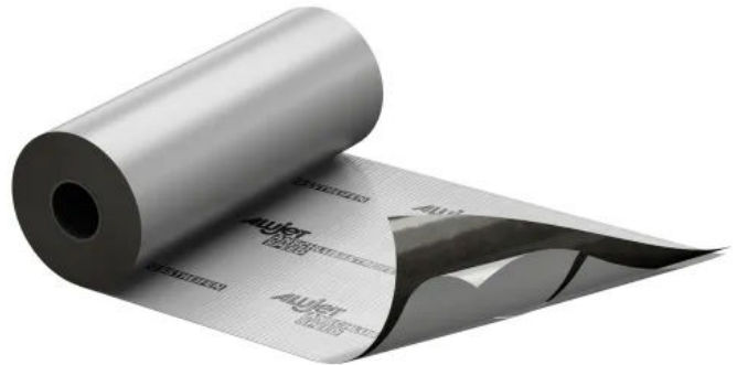
ALUJET Anschlussstreifen SPEED

Der ALUJET Anschlussstreifen SPEED ist ein 5-lagiges vollflächig selbstklebendes Verbundmaterial für den Einsatz als Systemkomponente der ALUJET Walljet ALU und der ALUJET Floorjet SPEED.