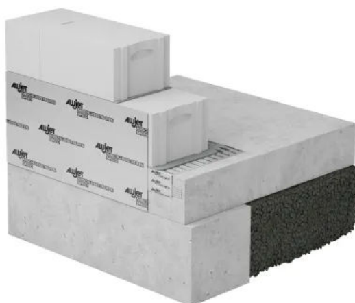
ALUJET Walljet ALU