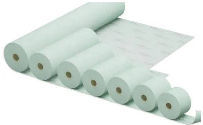
ALUJET Walljet PP

Die ALUJET Walljet PP besteht aus einem Verbundaufbau aus Polyethylen und Polypropylen.