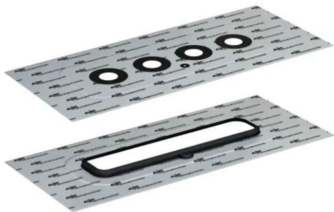
ALUJET Floorjet Manschetten