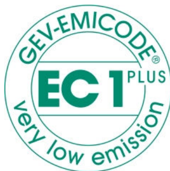
Zertifikat EC1 Plus