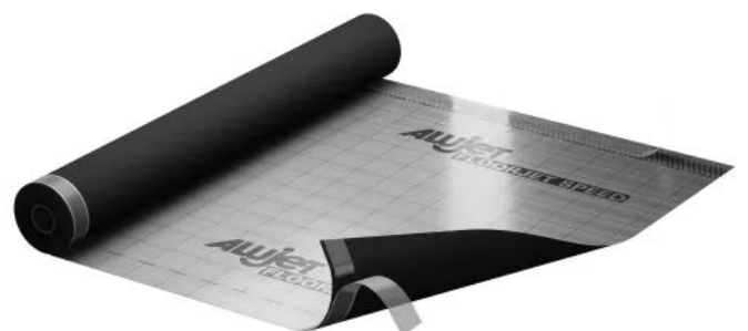
ALUJET Floorjet SPEED

Die ALUJET Floorjet Speed ist eine wärmereflektierende, bitumenfreie Abdichtungsbahn.