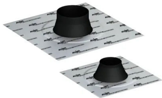
ALUJET Floorjet Manschetten