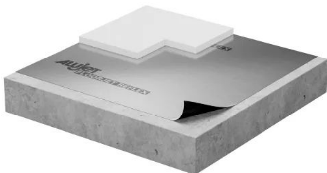
ALUJET Floorjet REFLEX