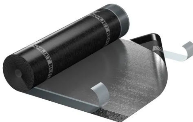
ALUJET Floorjet REFLEX

Die ALUJET Floorjet REFLEX ist eine 1,2 mm starke Abdichtungsbahn aus Elastomerbitumen mit einer geprüften Wärmereflexion von 50%.