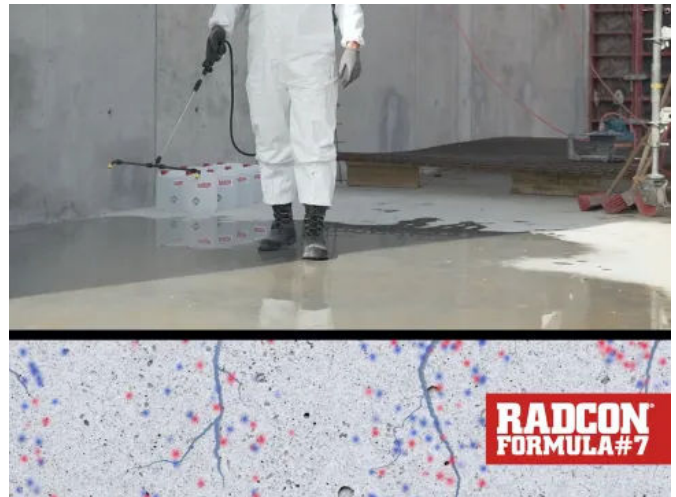
Radcon Formula #7® dringt in den Beton ein und verschließt die Oberfläche aktiv und dauerhaft.

Zahlreiche Referenzen weltweit mit über 10 Mio. Quadratmeter wasserdichtem Beton und die Verwendung bei über 3.000 Brücken belegen die Wirksamkeit von Radcon Formula #7®. Evershield garantiert bei bereits einmaliger Anwendung eine Wirkung von 10 Jahren.