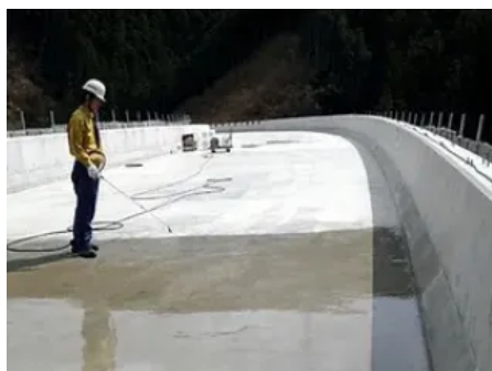
Radcon Formula #7® Anwendung — Brücke

Radcon Formula #7® wird auf die trockene Betonoberfläche aufgesprüht und anschließend gewässert. Nach ca. 6 Stunden ist die Oberfläche wieder voll belastbar.