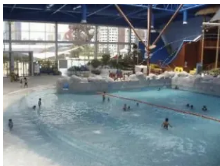
Radcon Formula #7® Anwendung — Wassertank/Pool