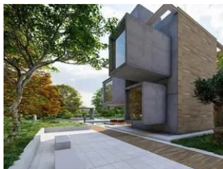
Radcon Formula #7® Anwendung — Fassade