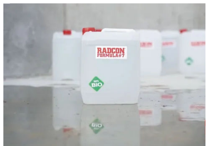
Radcon Formula #7®

Radcon Formula #7® ist ein vollständiger Ersatz für eine Membran, da es sowohl die Betonmatrix selbst als auch Risse abdichtet, selbst wenn diese hohen thermischen Beanspruchungen ausgesetzt sind. Das in den Beton eingedrungene Produkt bleibt dauerhaft reaktiv und reagiert mit Feuchtigkeit immer wieder neu.