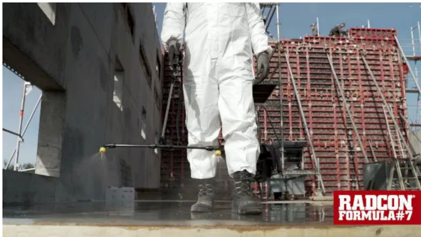
Film Radcon Formula #7®

Aus der Serie Abdichtung von Betonflächen - Hydrophobierung mit Silikatlösung von Evershield