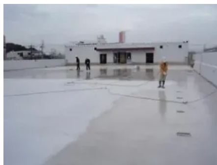
Radcon Formula #7® Anwendung — Dach