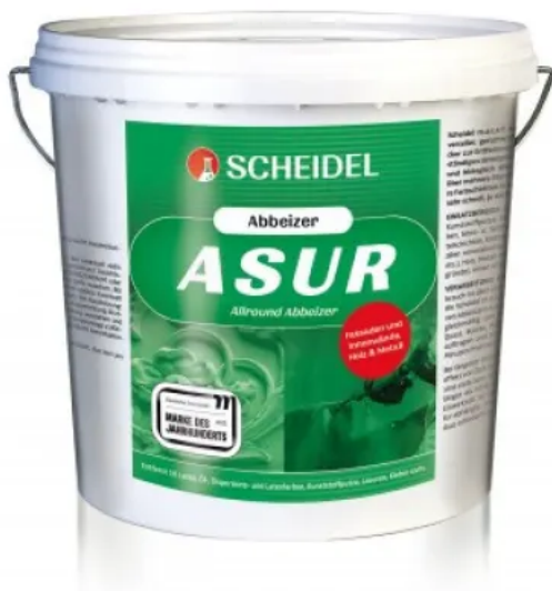
Asur Allround Abbeizer