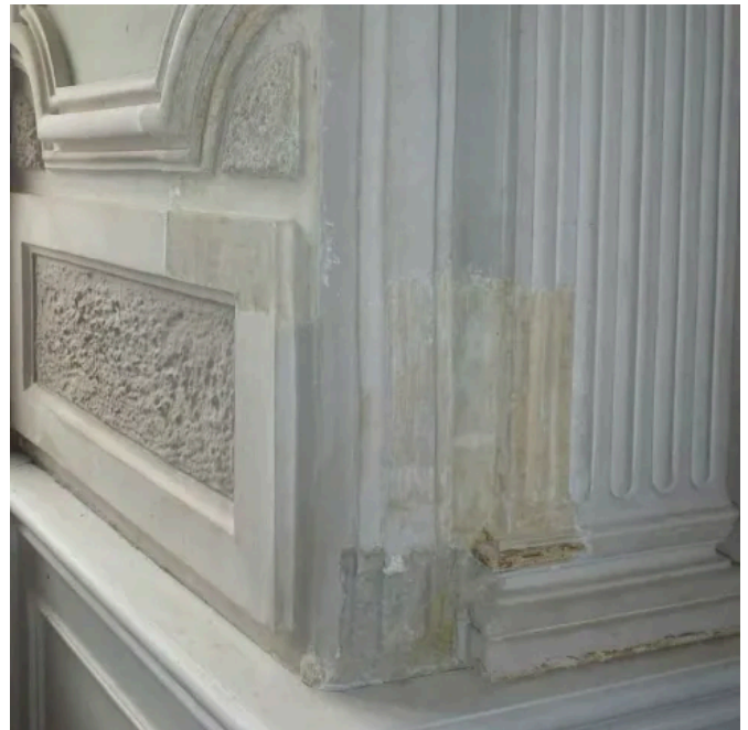
Drystrip Allround Trockenabbeizer für Fassaden und Innenbereich, mineralische Untergründe, Stuck, Holz, Metall.