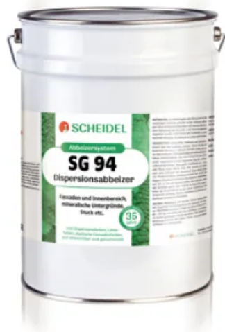
SG 94 Dispersionsabbeizer