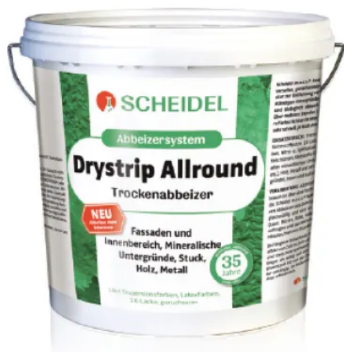
Drystrip Allround Trockenabbeizer