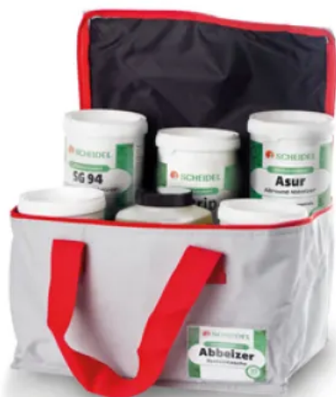
Systemtasche Abbeizer Testset

Mit Hilfe von Testflächen lässt sich der optimale Abbeizer für das Objekt ermitteln. Nach Aufziehen des Abbeizers ist der Lösevorgang in definierten Zeitabständen zu beobachten. Je nach Art und Stärke der zu entfernenden Beschichtung und der Umgebungstemperatur werden die Schichten unterschiedlich schnell gelöst.