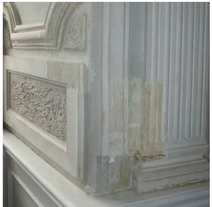
Drystrip Allround Trockenabbeizer für Fassaden und Innenbereich, mineralische Untergründe, Stuck, Holz, Metall.