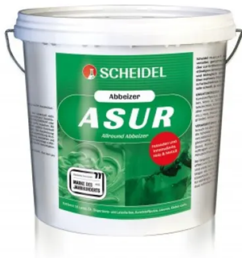
Asur Allround Abbeizer