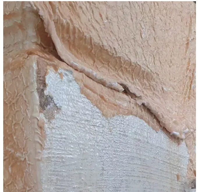
Asur Allround Abbeizer für Fassaden und Innenwände, Holz und Metall.