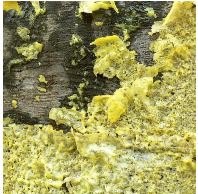
Oxystrip Superlöser 2K Abbeizer für Holz, Metall, mineralische Untergründe.