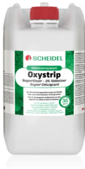
Oxystrip Superlöser 2K Abbeizer

Oxystrip Superlöser 2K Abbeizer für 2K-Beschichtungen und Lacke