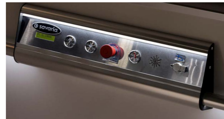
Beleuchtete Drucktasten mit Totmannsteuerung und Diagnosedisplay

Der abgebildete Lift ist mit einem optionalen Acrylgaseinsatz ausgestattet.