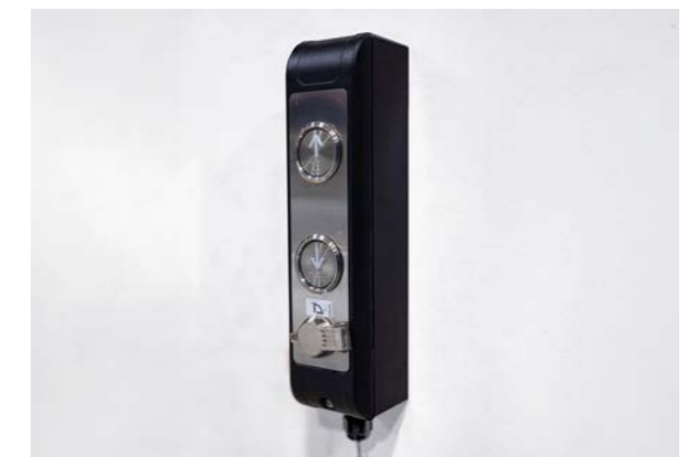
Separate Rufstation für optionale Pfosten- oder Wandmontage