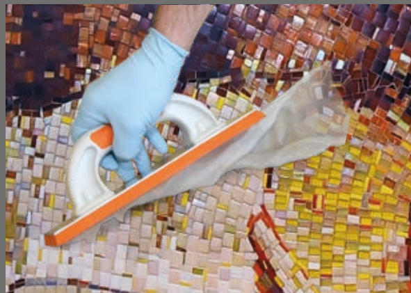
Sehr geschmeidiges Einfugverhalten, wie ein zementärer Fugenmörtel. Mit nur einer Hand, ohne Spezialwerkzeug.