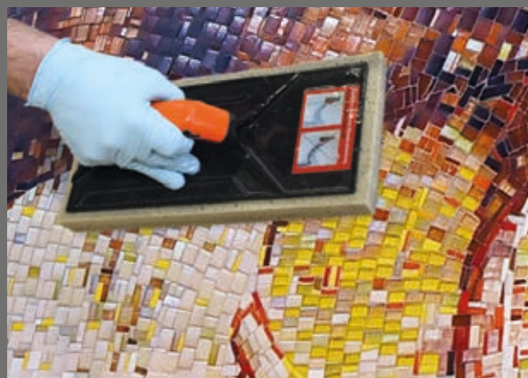
Sehr leichtes Waschverhalten ohne Restschleier – mit der Waschlösung PCI Durapox® Finish.