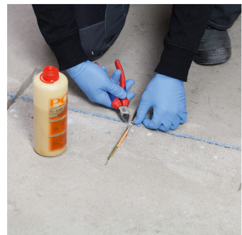
PCI Apogel® Dübel oder Estrichklammern in die Nut einlegen.