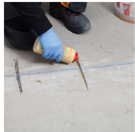
Etwas PCI Apogel® SH vorlegen.