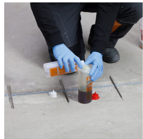
Wenn die zu vergießenden Fugen oder Nuten vorbereitet sind die beiden Komponenten von PCI Apogel® SH zusammenschütten.

Angemischtes Gießharz in die Risse/Fugen oberflächenbündig eingießen und Oberfläche glatt abziehen. Für einen besseren Verbund mit nachfolgenden Bodenausgleichsmassen/Spachtelmassen und Klebstoffen sofort im Anschluss mit trockenem Quarzsand abstreuen. Feine Risse aufgrund der schnellen Erhärtung möglichst innerhalb kurzer Zeit nach dem Anmischen von PCI Apogel SH verfüllen. Bei breiteren Rissen/Fugen ist es besser das angemischte Gießharz in der Flasche kurze Zeit vorreagieren lassen, bis sich eine etwas dickflüssigere Konsistenz eingestellt hat.