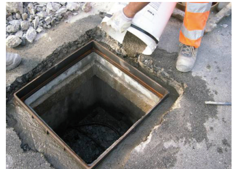
Ausgießen eines Kanalschachtrahmens mit PCI Repafast Fluid.