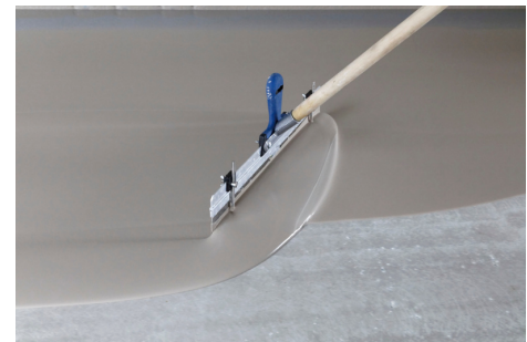
PCI FT Plan überzeugt mit einem sehr guten Verlauf und einer glatten Oberfläche