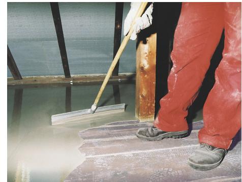
Faserarmiertes PCI Periplan Extra eignet sich hervorragend für Renovierungs- und Modernisierungsarbeiten beim Ausgleich von Holzdielen- und Spanplattenböden.