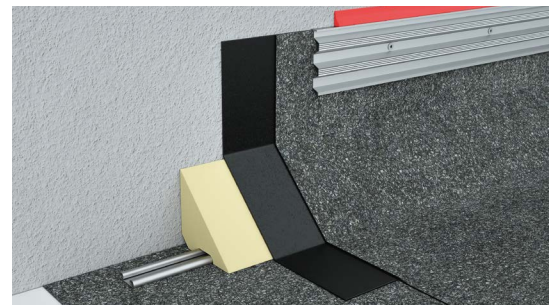
Versiegelung an einem Wandanschluss aus Bitumen