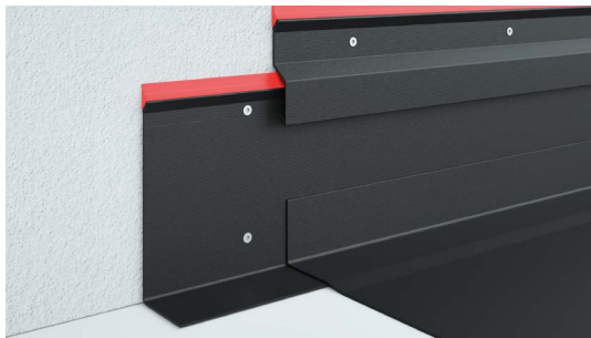
Wandanschluss hinter Verbundblech