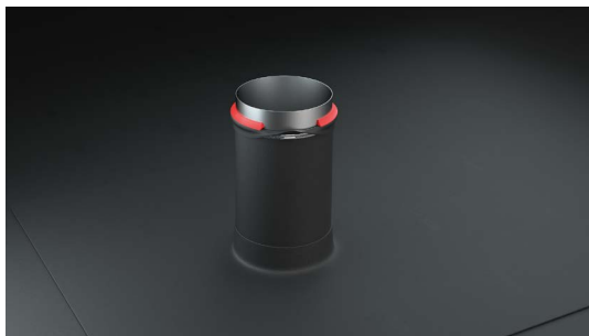
Abschluss von Durchdringungen im Innen- und Außenbereich