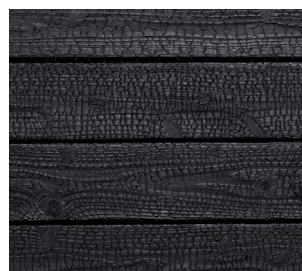
#732 ebony (Int/Ext) | Matt