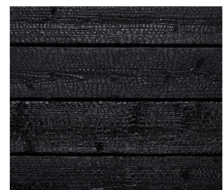
#932 ebony (Int) | Seidenglanz