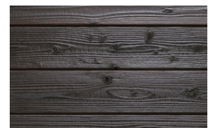
#121 light oak (Int/Ext)

Transparente/helle Pigmentierungen ohne UV-Blocker (wie #101 und #121) lassen Gendai in den ersten Monaten aufhellen.