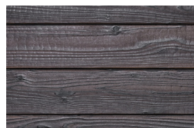
#101 transparent (Int/Ext)