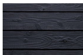
#331 ebony (Int/Ext)