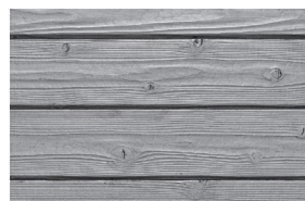
#112 silver grey (Int/Ext)

Transparente/helle Pigmentierungen ohne UV-Blocker (wie #101 und #121) lassen Gendai in den ersten Monaten aufhellen.