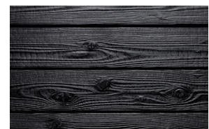
#132 ebony (Int/Ext)