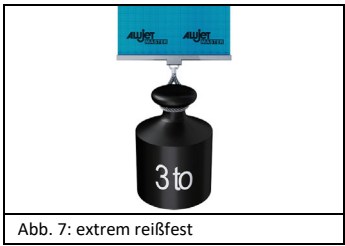
Abb. 7: extrem reißfest