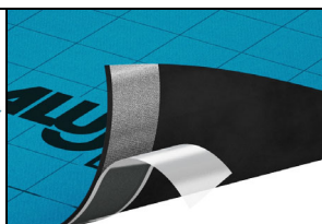
Abb. 2: Selbstklebestreifen