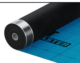
Abb. 3: ALUJET Master