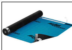
Abb. 1: ALUJET Master