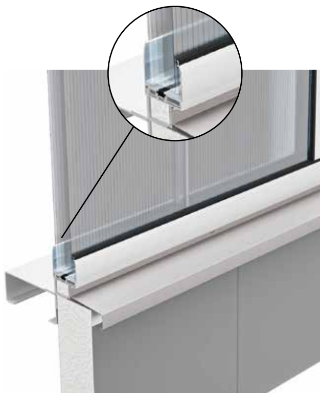
Funktionsfassade Aurora im Schnitt mit PC 60/13 Verglasung