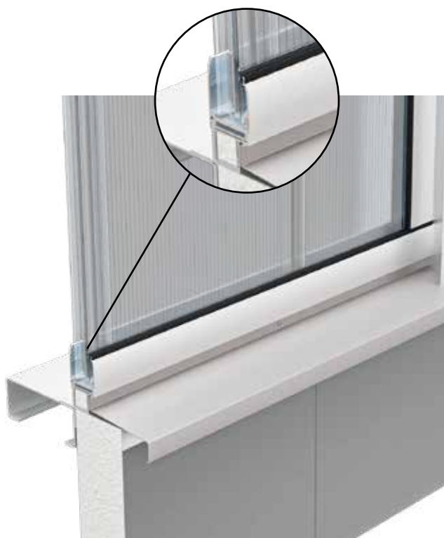
Funktionsfassade Aurora im Schnitt mit PC 40/7 Verglasung