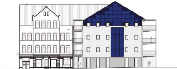
Ansichten aus beiden angrenzenden Straßen

ohnein sehr sparsam im Verbrauch geworden sind. Schulungsmaßnahmen oder Prämien für einen geringen Energiebedarf, wie sie für Masdar City geplant sind, sind deshalb hierzulande überflüssig.“